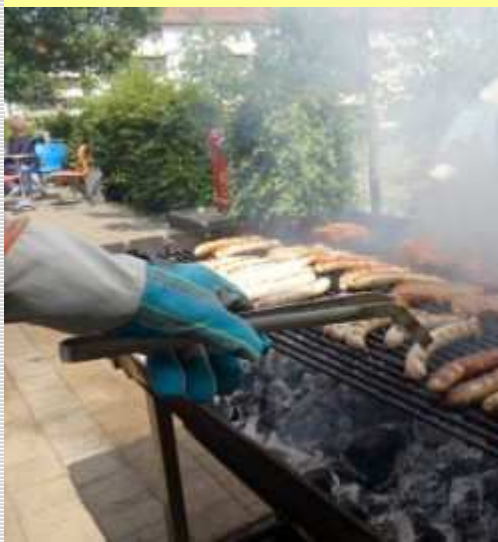
Leckeres vom Grill