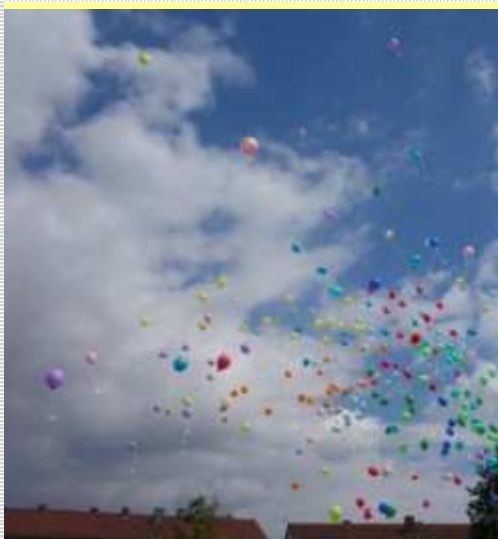
...und ab nach Südosten...