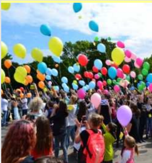
Los geht's mit den Ballons...