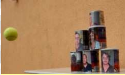
Dosenwerfen auf die Lehrer