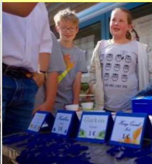
...noch mehr von der 6b...