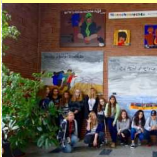
"Menschenrechte" in Gemälden der 7a