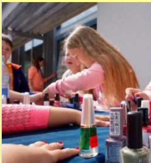
Schönheitsprodukte von der 6b...