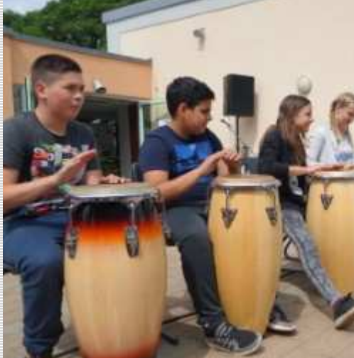
Musik und Rhythmus AG